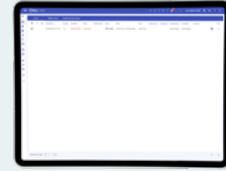
Käynnissä olevien hälytysten luettelonäkymä