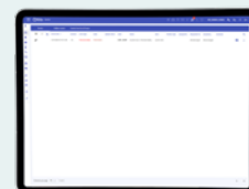
Liste des alarmes en cours