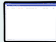
Vista elenco degli allarmi correnti