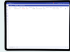
Lijstweergave van actuele alarmen