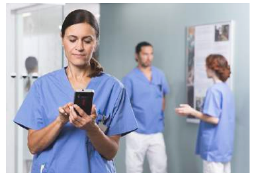
Von unterwegs auf Laborergebnisse, Bilder, Anfragen und Alarmer zugreifen.