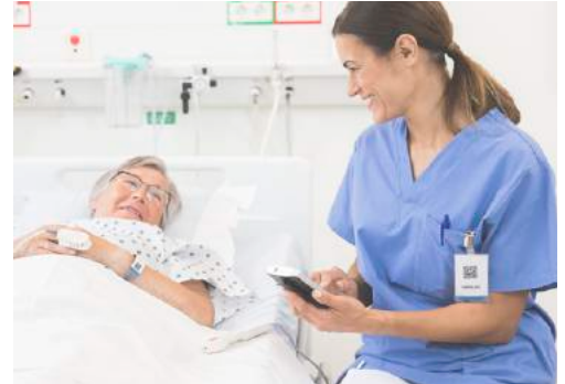
Zentraler Eintrag der Vitalparameter in die EPA, ohne den Patienten zu verlassen.

Die Ascom Myco 3 Lösung stellt ein breites Spektrum an aktuellen klinischen Daten zur Verfügung.