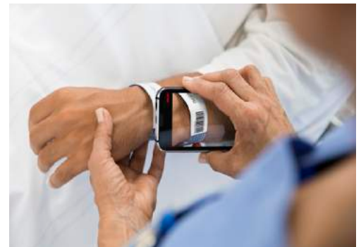
Barcode-Scanning: Sichere Überprüfung von Patienten-IDs bei der Verabreichung von Medikamenten.