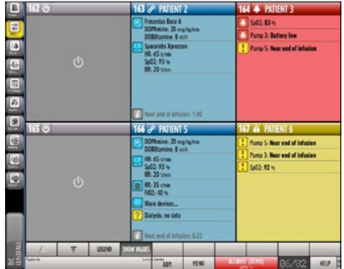
Esimerkkikuva Digistat® Smart Central -näytöstä: 6 vuotta ja potilaiden vitalitiedot potilasvalvontalaitteesta, hengityskoneesta ja infuusiopumpusta sekä muutamia hälytyksiä ja varoituksia.

Järjestelmä voidaan ohjelmoida myös antamaan äänimerkki uusista tapahtumista osastolla.