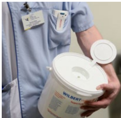
Lingettes désinfectantes prêtes à l'emploi dans un contenant de stockage sécurisé à l'hôpital St. Martinus, Olpe en Allemagne.