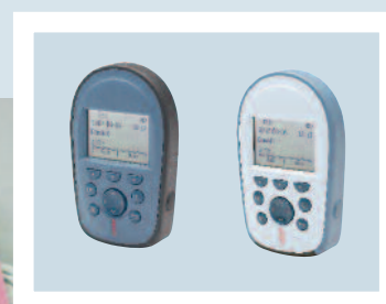
Emetteur* / récepteur Ascom p71. *en option

Les messages peuvent être directement envoyés depuis tout PC connecté au réseau local vers tout récepteur du système. Le bon message est envoyé à la bonne personne, au bon moment, où qu'elle se trouve.