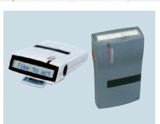
Récepteur Ascom 914DC.