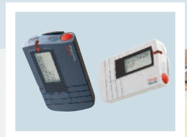
Récepteur Ascom 912T.

En installant un système teleCOURIER, vous pouvez attendre une plus grande efficacité de votre organisation. Une information et une réponse plus réactives augmentent tout à la fois votre productivité et votre niveau de qualité et en conséquence vous aident à contrôler vos coûts.