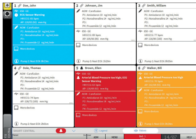
Un'immagine esemplificativa della schermata di Digistat® Smart Central , che mostra 6 letti con riportati i parametri vitali del paziente raccolti da monitor, ventilatori e pompe ad infusione inclusi alcuni allarmi ed avvisi.

Per avere le specifiche complete, le caratteristiche e le limitazioni del prodotto si prega di far riferimento al Manuale d'Uso e al Manuale Utente o contattare direttamente ASCOM UMS all'indirizzo it.info@ascom.com