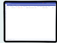
Lijstweergave van actuele alarmen