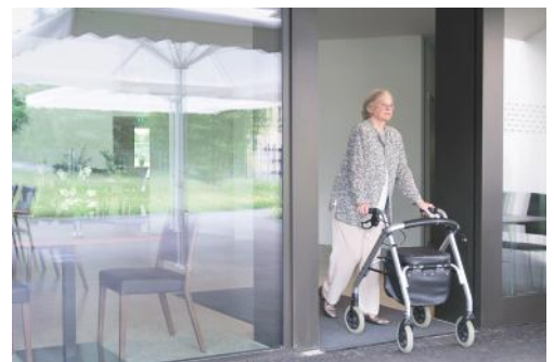
Lokalisieren gefährdeter Personen. Die Standorte der Bewohner werden auf das Ascom Myco 3 der Betreuer übertragen und angezeigt.