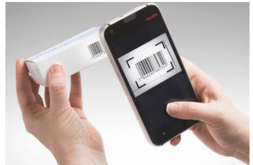
Personalisierte Pflege. Pflegekräfte können auf Pflegepläne zugreifen und mit dem Barcodescanner die Medikamentenpläne überprüfen.