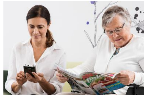
Ein Multifunktionsgerät. Mit Bewohnern Kontakt aufnehmen, sich mit Kollegen abstimmen, Alarme und Warnmeldungen verwalten und sich mit technischen- und Alarmsystemen verbinden.