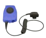
Peltor-adapter d81 Art.nr. 660281