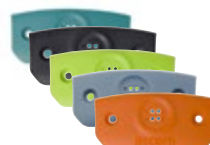
Frontplate d81 Art.nr. 660302, 660334, 660303, 660304, 660305