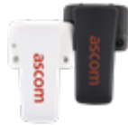
Standardklips d63/i63 Art.nr. 660517, sort 660518, hvit (kun d63)