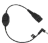
Headsetadapter QD d43/d63/i63 Art.nr. 660515