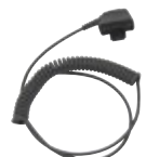
Reservekabel Peltor d81 Art.nr. 660337

*Utenfor Europa må en strømledning med C13-kontakt kjøpes separat. I Europa er strømledningen med C13-kontakt tilgjengelig fra Ascom (art.nr. 660339).