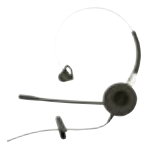
Headset med bøylemikrofon QD Art.nr. 660508 Krever headsetadapter