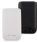
Batteripakke d63/i63 Art.nr. 660497, sort 660507, hvit (kun d63)